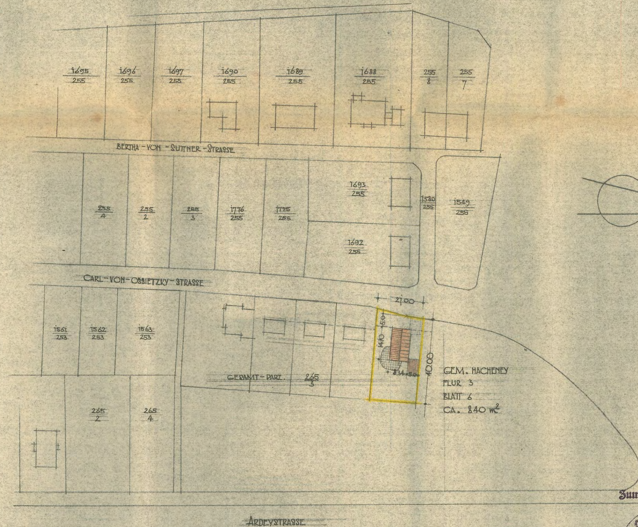
LAGEPLAN M. 1:1000

Zum Schreiben 52/2-1837-gebörig Dortmund, den 20. Juni 1956