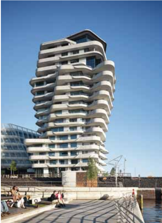
WOHNTURM MARCO-POLO-TOWER Hamburg HafenCity, 2010

Architekten Behnisch Architekten, Stuttgart Bauherr Projektgesellschaft Marco-Polo- Tower GmbH & Co KG, Hamburg