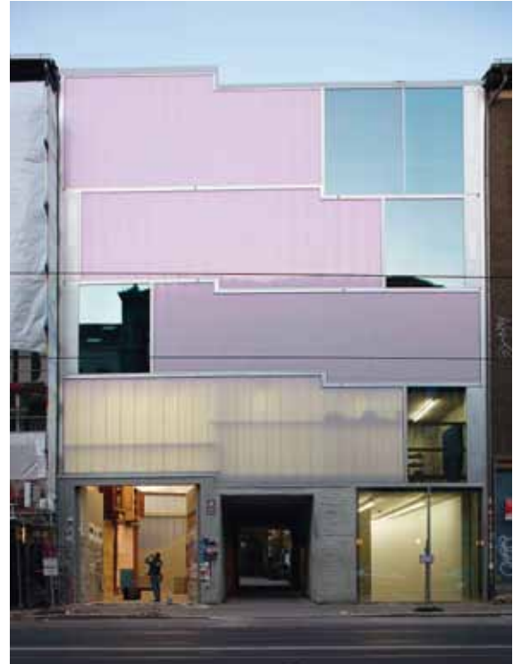
0013 BRUNNENSTRASSE GALERIE- UND ATELIERGEBÄUDE Berlin, 2010

Das Galerie- und Ateliergebäude schließt auf den Fundamenten einer Investorenruine aus den 1990er Jahren eine der letzten Baulücken in Berlin-Mitte. Die Struktur des Bestandes – das Kellergeschoss sowie der Aufzugsschacht – wurde in die neue Planung integriert. Konsequenterweise setzen die Architekten ihre Konzeption eines nutzungsoffenen Gebäudes vom scheinbar unfertigen Inneren bis zu den flexibel austauschbaren Fassadenelementen um. Dabei erreicht das Gebäude in Materialität, Haltung und Programm eine hohe Eigenständigkeit gegenüber seiner urbanen Nachbarschaft, gleichwohl deren Geschoss- und Traufhöhe fortgeführt wird. So fügt sich die Radikalität im Erscheinungsbild in das bestehende Straßenbild ein.