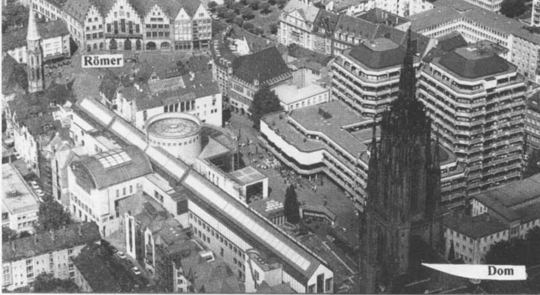
1. Frankfurt am Main