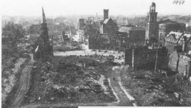
Blick zum Römer 1947