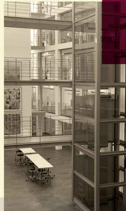
AIC © STANDORT KÖLN

Als NAX-Partner, Makler des Bund Deutscher Architektinnen und Architekten BDA kennen wir die Herausforderungen, die renommierte Planer bewegen. Architekten, Ingenieure, Generalplaner und technische Gesamtplaner können sich auf unsere Expertise verlassen. Mit unserer unabhängigen Schaden- und Rechtsabteilung sorgen wir für die Durchsetzung der versicherten Schäden und sind zentraler Ansprechpartner für alle Vertragsanpassungen. Mit unserem 360 Grad Rundum-Service erhalten unsere Kunden die bestmögliche Absicherung in Kombination mit einem modernen Risiko-Management.