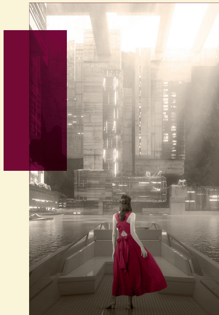
LAVA Laboratory for Visionary Architecture GmbH ® , Rendering NEOM Teilprojekt, SA